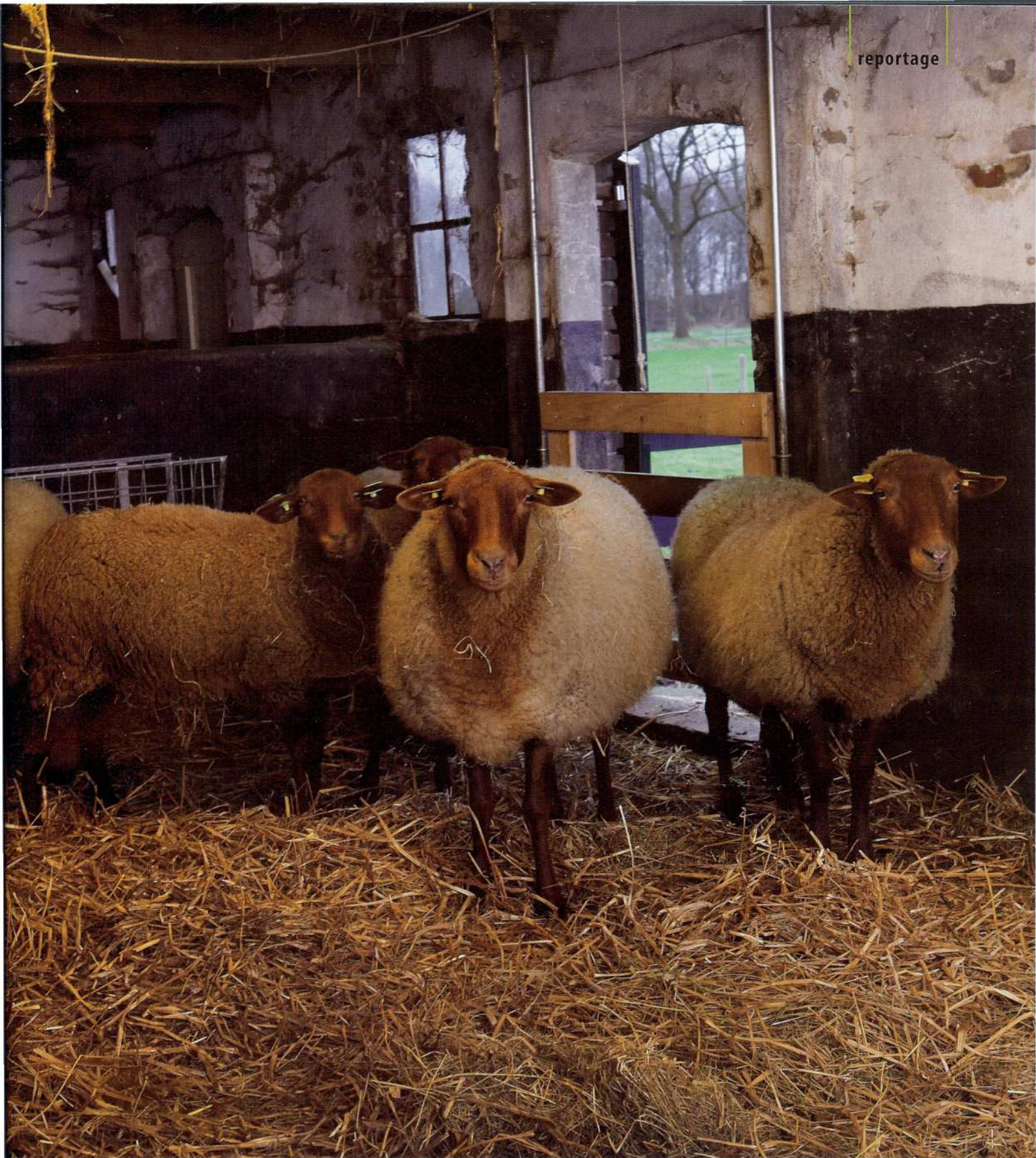
De schapen in de stal. Links, met de donkerbruine kleur, een oilam van afgelopen jaar.

wordt onderling uitgewisseld”, vertelt Judith. “Maar volgend jaar moet er weer een andere ram komen. Als we dit jaar oilammetjes krijgen, kunnen we met deze niet meer uit de voeten.”